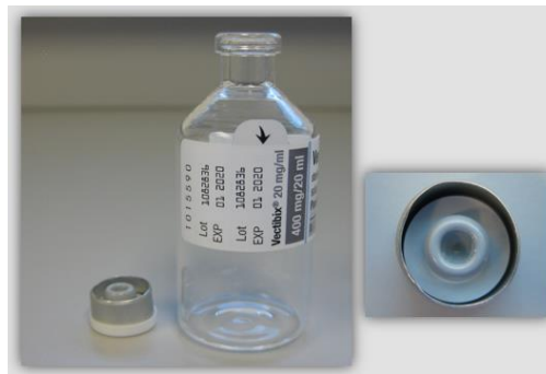
Abbildung 2: Durchstechflasche mit Aluminiumverschluss und Elastomerstopfen, die abgegangen ist, als die abnehmbare Plastikkappe entfernt wurde