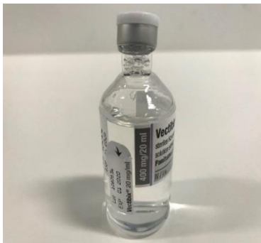
Abbildung 1: Durchstechflasche mit schiefem Elastomerstopfen und Aluminiumverschluss

Etwa 5,5 % der Durchstechflaschen aus diesen Chargen können betroffen sein. Seit Mitte März 2018 vertreibt Amgen andere Vectibix-Chargen, die von diesem Defekt nicht betroffen sind.